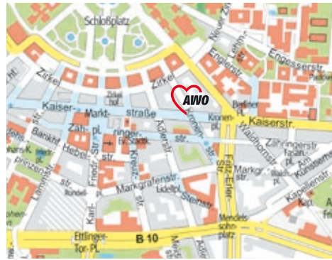
Kartografie mit freundlicher Genehmigung der Stadt Karlsruhe; VWV, Kartografie