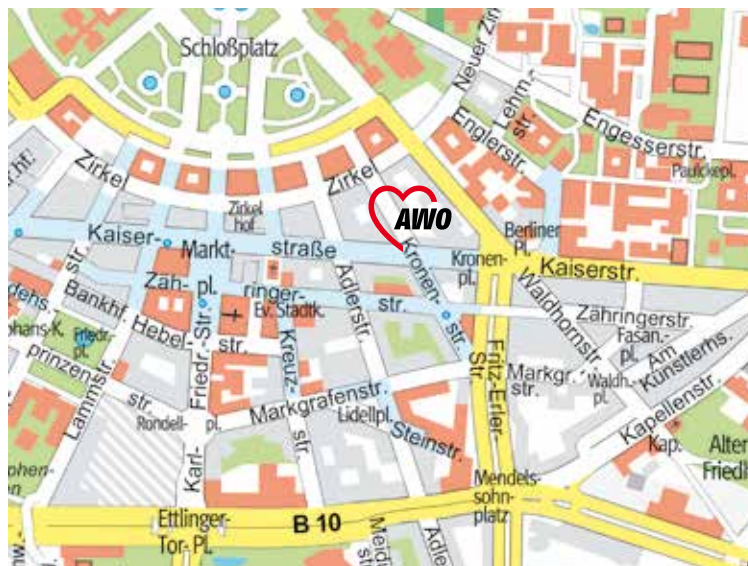
Kartografie mit freundlicher Genehmigung der Stadt Karlsruhe; VLW, Kartografie

Die SPFH stellt eine Hilfe zur Erziehung auf der Grundlage des §27 i. V. §31 SGB VIII dar und wird über den Sozialen Dienst im jeweiligen Stadtteil beantragt. Die SPFH ist ein Angebot des Sozialtherapeutischen Kinder- und Jugendhilfeverbundes der AWO. In diesem Verbund sind seit 2005 alle Einrichtungen der AWO zusammengefasst, die eine Hilfe zur Erziehung nach dem SGB VIII leisten oder diese ergänzen.