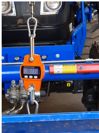
Selbst bei Belastungen über 150 kg bleibt die Leine stabil.