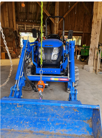
Leine wird zwischen Traktor und Seilzug eingespannt und ca. 3 Min. belastet.