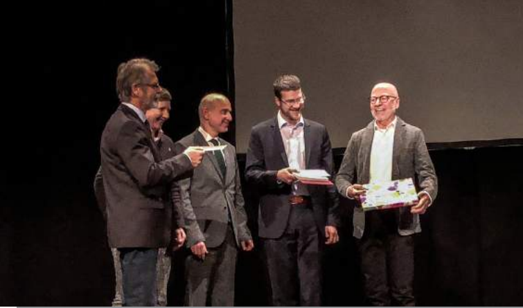
Die Kolleginnen und Kollegen der LIGA Karlsruhe bedankten sich für die gute Zusammenarbeit.