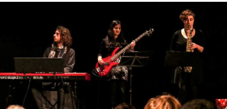
Die Band „Combo around Jazz“ sorgte für die musikalische Unterhaltung.