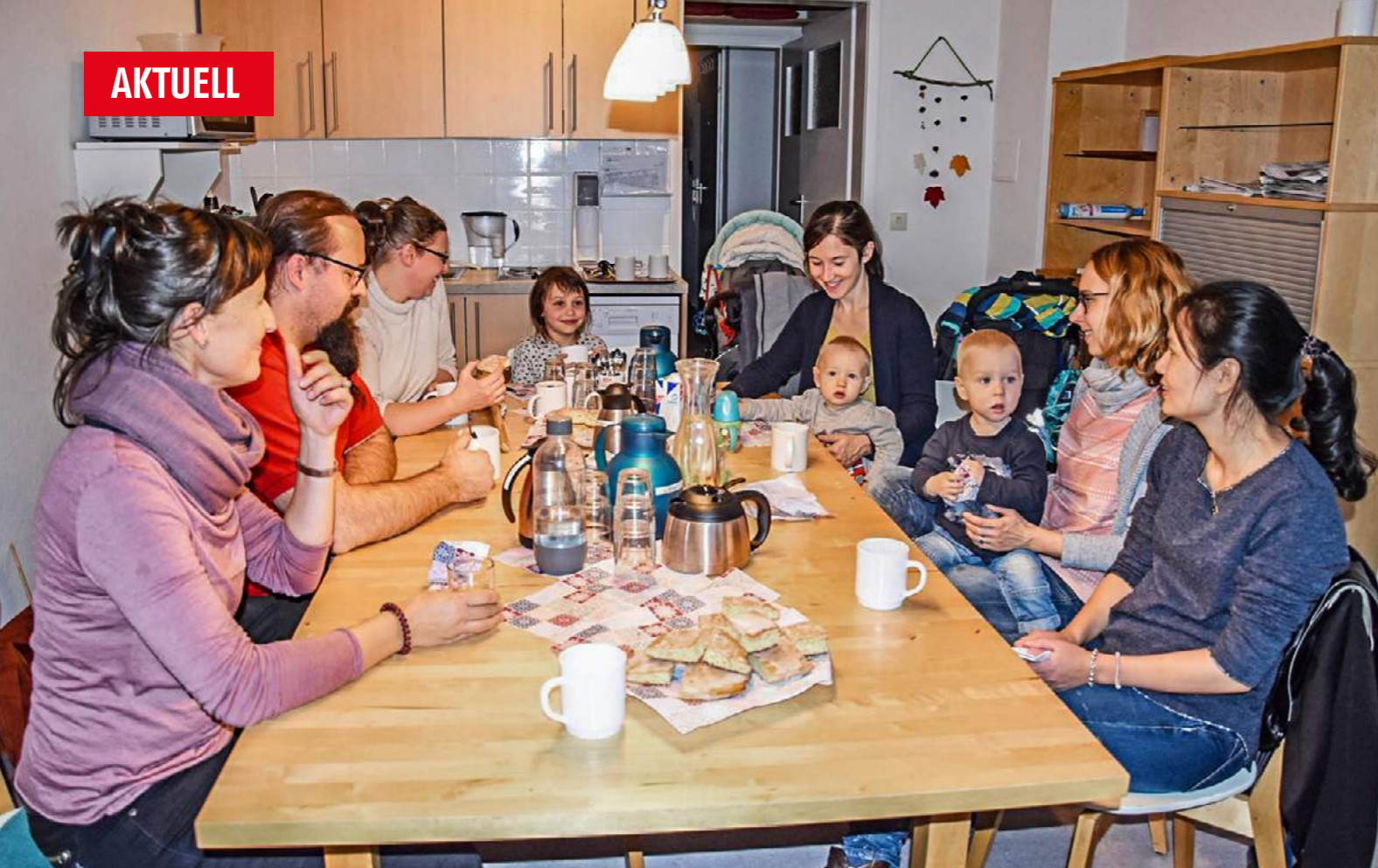
In dem neu entstehenden Kinder- und Familienzentrum der AWO Kita Krone können Eltern und Kinder neben Beratungs- und Begleitungsangeboten auch zwanglos vielfältige Kontakte knüpfen.