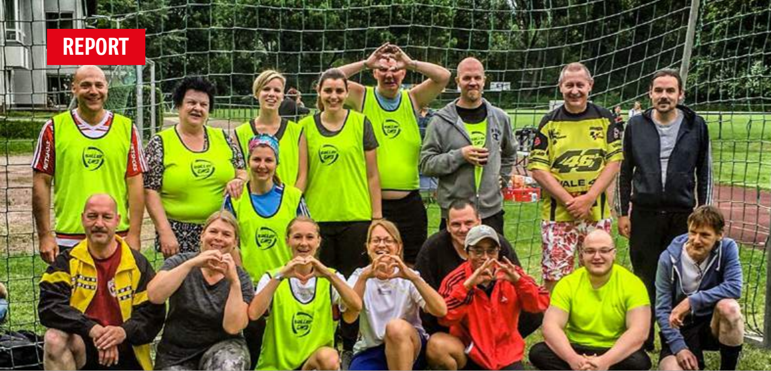
Das Team aus den beiden AWO Einrichtungen hatte viel Spaß beim Fußballturnier.