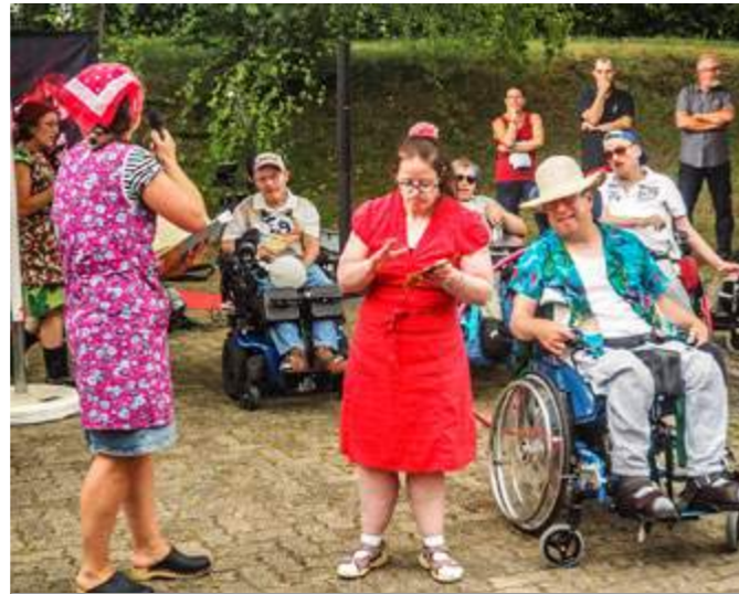
25 Jahre Haus Spielberg – auch die Bewohner*innen des Haus Spielbergs ließen es sich nicht nehmen, das Programm des Sommerfestes mitzugestalten.

Für Menschen mit schweren Behinderungen, die zu Hause wohnen, bietet das Haus Spielberg noch die Möglichkeit, am Tagwerk teilzunehmen. Dabei handelt es sich um ein Angebot, das auf die Fähigkeiten und Bedürfnisse zur Förderung der vorhandenen Stärken abgestimmt ist und bei dem die Teilnehmer*innen viele schöne Sachen herstellen, die später auf Märkten in der Region und bei Festen im Haus verkauft werden.