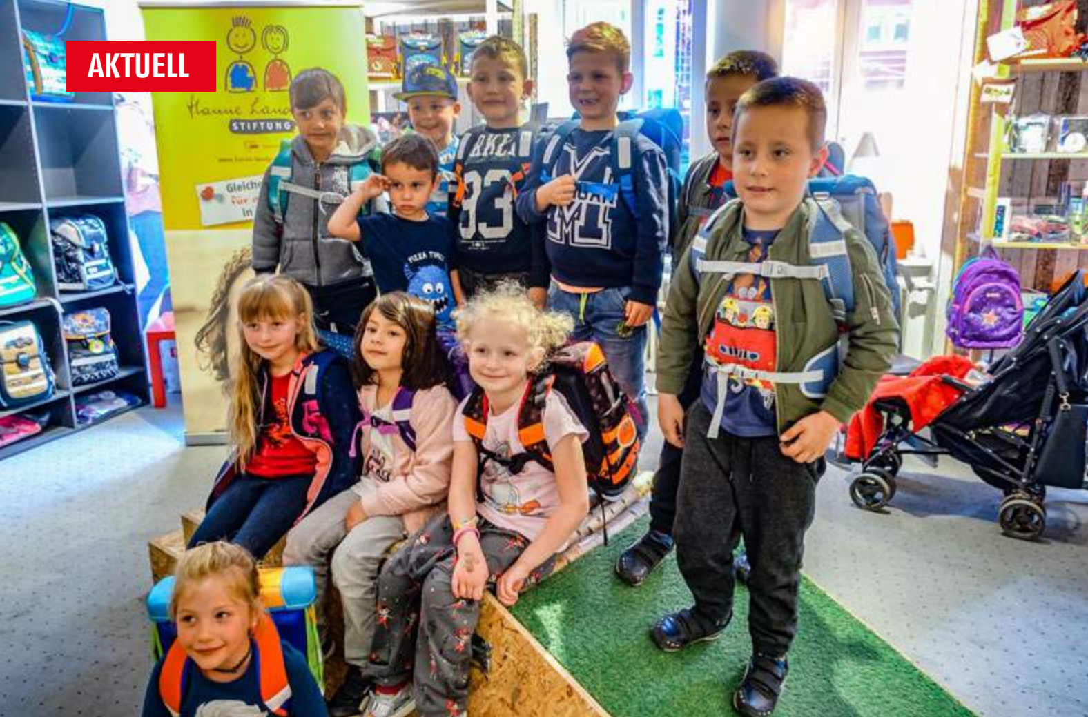
Schulranzen-Aktion der Hanne-Landgraf-Stiftung gemeinsam mit dem Stiftungspartner PapierFischer: Beim Schulstart in der ersten Reihe stehen dürfen!