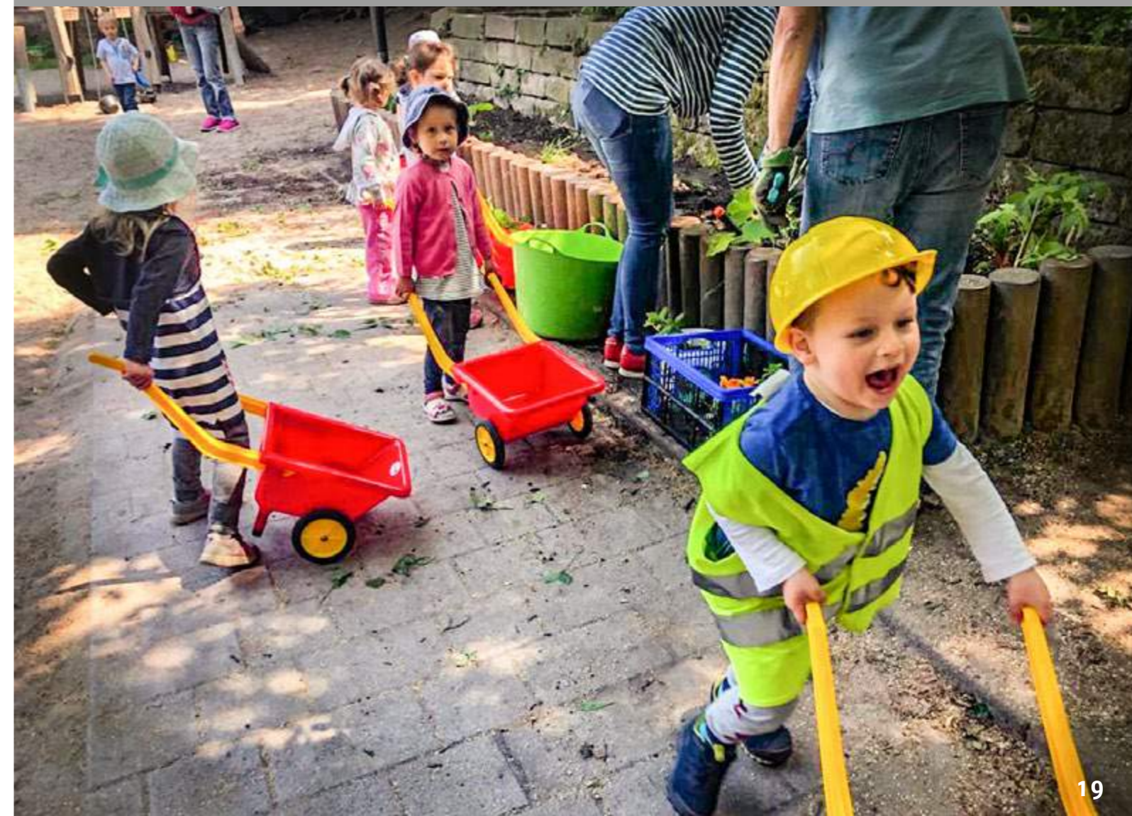
Die Kinder der Kita Villa verschönern eifrig ihren Garten.

Der Gartentag wurde vor 20 Jahren vom damaligen Elternbeirat ins Leben gerufen. Seitdem findet er jedes Jahr in Kooperation mit der Kita-Leitung statt und erfreut sich seitdem an einer stetig wachsenden Beliebtheit