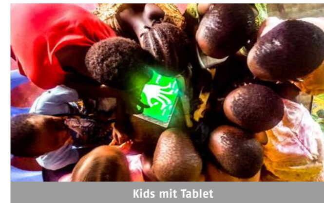
Kids mit Tablet

Am liebsten bin ich aber bei meinem Dutzend DAOS-Kindern. Wir spielen Uno, malen oder spielen mit meinem mitgebrachten Tablett. Am größten ist die Begeisterung, wenn Kenyan Hip-Hop oder Rap in größtmöglicher Lautstärke von YouTube zum Tanzen und Auspowern abgespielt wird. Wobei das Video genau beobachtet wird, um sich so zu bewegen wie die Stars.