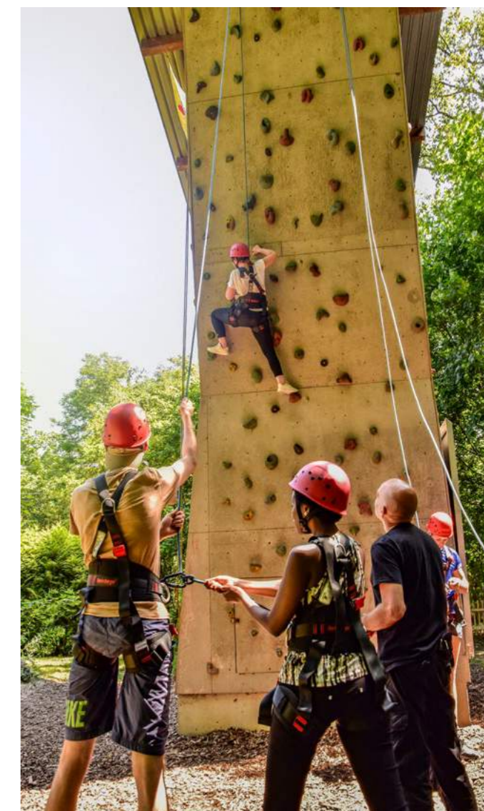
Das gemeinsame Erklimmen des Kletterturms in der AWO Einrichtung EPA – Erlebnis.Pädagogik.Abenteuer hilft jungen Menschen mit und ohne Fluchthintergrund u.a. Selbstvertrauen und ihre Sozialkompetenz zu stärken.

Die AWO Karlsruhe gemeinnützige GmbH ist ein Träger bei dem Solidarität, Gerechtigkeit, Freiheit, Gleichheit, und Toleranz im Mittelpunkt des Leitbildes stehen. „Das heißt auch, dass die AWO sich für die Integration von geflüchteten oder zugewanderten Menschen einsetzt und so politisch Stellung bezieht“, betont Mehnert. Dazu gehört auch die Auseinandersetzung mit Vorurteilen und Rassismus. Im Fokus stehen das Erlernen von Interkultureller Kompetenz, Offenheit und Toleranz.