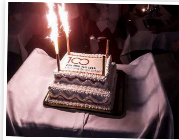
Eine Eistorte zum Jubiläum

Südstadt ist Leben. So lautet das Motto des Stadtteils, welches sich auch perfekt auf die AWO Südstadt übertragen lässt. Den 100. Geburtstag wurde mit den Mitgliedern und Gästen in der Begegnungsstätte gefeiert.