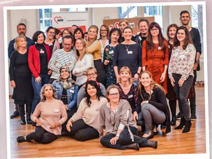
Die Mitarbeiter*innen der AWO SPFH

Die SPFH richtet sich an alle Familien mit minderjährigen Kindern, die in schwierigen Lebenssituationen Unterstützung suchen und kann Hilfe zur Selbsthilfe geben, die eigenen Fähigkeiten zu erkennen und zu nutzen und entsprechend ihres Lebenskonzeptes Lösungen für die ganz individuellen Schwierigkeiten der Familie zu finden. Die Familienhelfer*innen arbeiten mit der Familie in ihrem Umfeld. Je nach Bedarf und Zielen finden gemeinsame Gespräche in Kindertagesstätten und Schulen statt. Auch die Begleitung zu Jobcenter, Arbeitsamt, Ärzten, Therapeuten, Frühförderstellen und vieles mehr sind möglich.