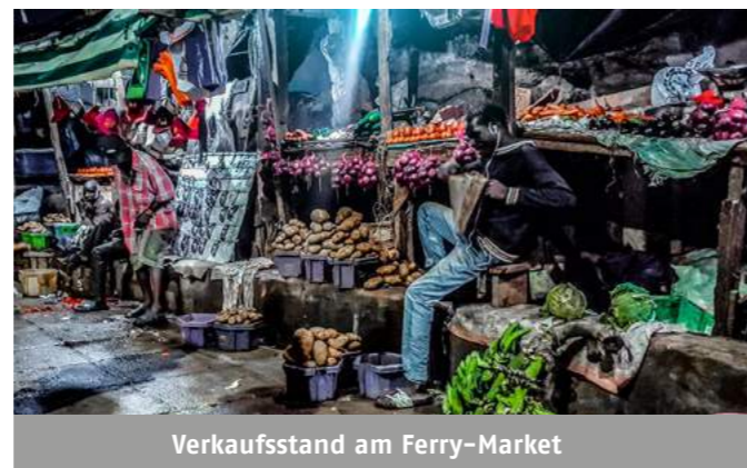
Verkaufsstand am Ferry-Market

Zwischen Guesthouse und DAOS-Haus liegen knapp 10 Minuten mit einem Motorrad-Taxi oder 25 Minuten Fußweg. Alle paar Meter gibt es kleine Geschäfte. Die Leute sind freundlich, freuen sich über dein „Jambo“ (Hallo), fragen „how are you“ und verkaufen dir gerne etwas. Gehandelt wird praktisch nicht, aber es werden auch keine Mondpreise verlangt. Nie hat jemand versucht, mich zu betrügen. Ich bin kein Tourist, sondern nur der einzige Weiße weit und breit. In vier Wochen habe ich keinen zweiten gesehen.