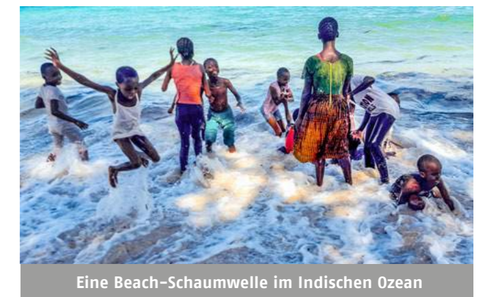
Eine Beach-Schaumwelle im Indischen Ozean

Ich hatte mir vorgestellt, einmalig nach Likoni zu fliegen um Neues zu sehen, zu erleben, aktiv bei diesem begeisternden und sinnvollen Projekt mitzumachen. Darüber hinaus haben mich Freunde und Verwandte in der Heimat so tatkräftig unterstützt, dass in einer Woche das Geld zur Anschaffung einer Waschmaschine zusammenkam, die den Frauen vor Ort jetzt nicht nur zwei Tage pro Woche einspart, sondern auch das Arbeiten am Boden in Waschküchen. Tausend Dank!