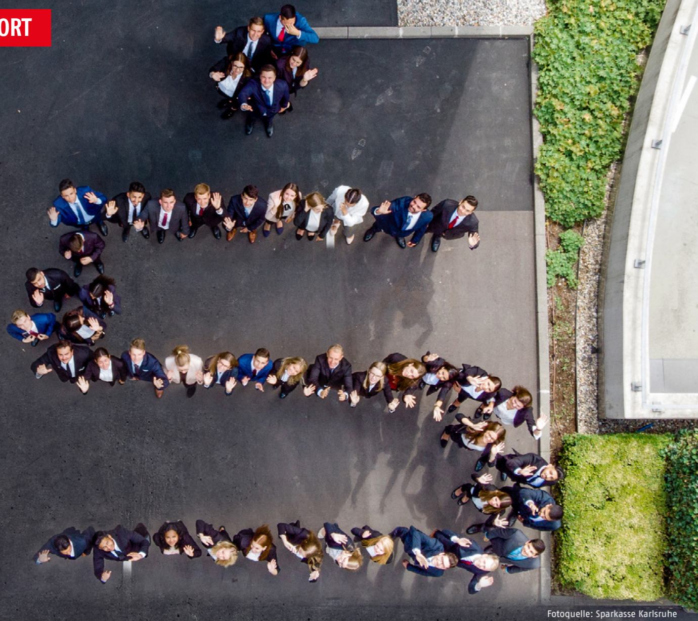
Die Azubis der Sparkasse Karlsruhe