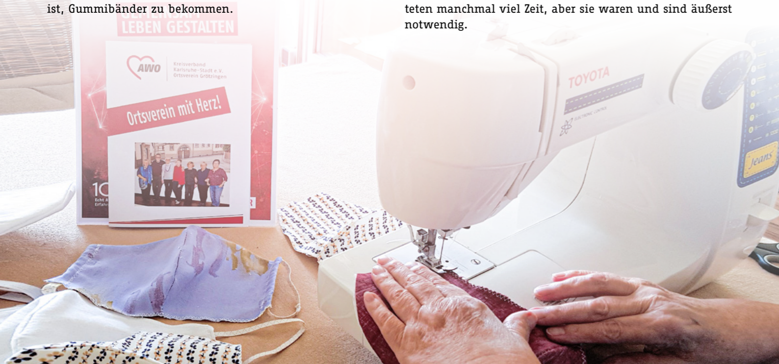
10 Eine weitere Aktion im Ortsverein: 5 Mitglieder haben für die Mitglieder über 200 Mund-Nasen-Bedeckungen genäht.