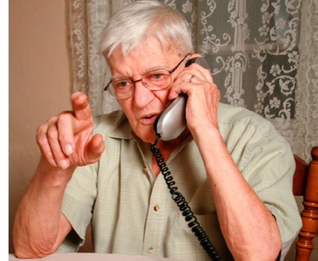
Der AWO Stadtbezirk Südstadt hat ebenfalls regelmäßig telefonischen Kontakt mit den Mitglieder und Besucher*innen der Begegnungsstätte aufgenommen, auch untereinander standen die Telefone nicht still. Weitere Unterstützung folgte durch Einkäufe und bedürftige Menschen wurden auch mit kleinen Kuchen überrascht.