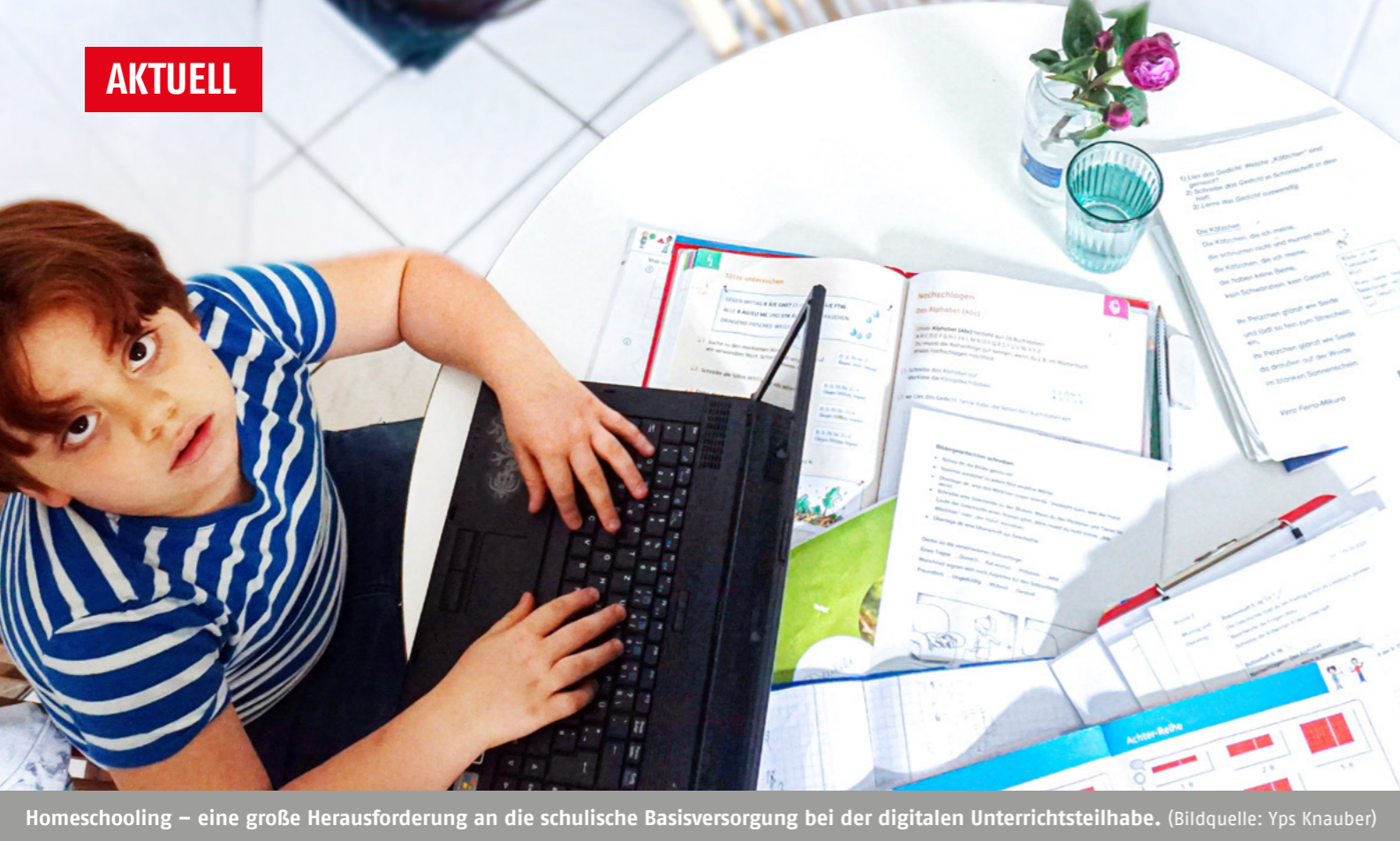
Homeschooling – eine große Herausforderung an die schulische Basisversorgung bei der digitalen Unterrichtsteilnahme.