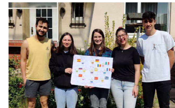
Die Europäischen Freiwilligendienstler*innen unterstützen die Aktion

Frieden gründet sich in Werten wie Freiheit, Solidarität, Toleranz, Gleichheit und Gerechtigkeit. Diese Werte sind kein Selbstverständnis und erodieren, wenn sie nicht gepflegt werden. Die Pflege von Werten beinhaltet nicht nur deren Vermittlung sondern auch die Auseinandersetzung darüber, welche praktische Bedeutung sie haben sollen- insbesondere in unserer sich mit hoher Dynamik wandelnden Gesellschaft.