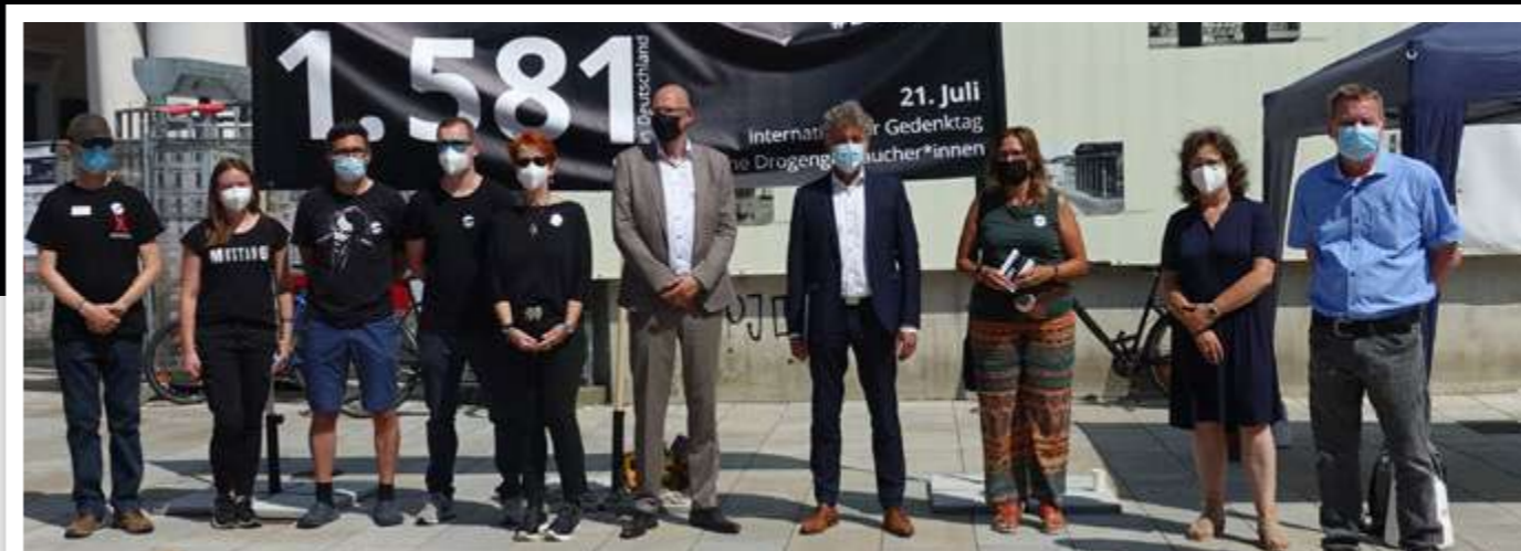
AWO und Stadt gemeinsam für eine verantwortungsvolle Drogenpolitik in Karlsruhe

Seit 1990 sind in Deutschland 39.000 Menschen durch den Konsum illegaler Drogen gestorben. Nachdem in den 2000er Jahren die Zahlen allmählich sanken, steigen sie seit 2018 wieder und haben im Jahr 2020 einen traurigen Höchststand mit 1581 Verstorbenen in Deutschland erreicht. Dies sind nur die Zahlen der Polizeistatistik, d.h. die Menschen, die eindeutig als „Drogentote“ (mit der Spritze im Arm) zu erkennen waren. Die Menschen, die an den Langzeitfolgen ihrer Sucht viel früher sterben als andere Menschen, sind hier nicht erfasst.