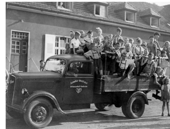
Eine Herausforderung war es, die Stadtkinder zum Gelände des Waldheimes zu transportieren, da es keine öffentlichen Verkehrsmittel gab. Schließlich wurden die Kinder mit dem „blauen Opel-Blitz“ der AWO auf der Ladefläche für die Stadtranderholung abgeholt.

Das Waldheim der AWO Karlsruhe war seit seiner Gründung 1946 ein besonderer Ort der Erholung für Kinder aus benachteiligten Familien. Hanne Landgraf und ihr Vater Karl Siebert hatten die visionäre Idee, die Stadtranderholung ins Leben zu rufen, um diesen Kindern eine Möglichkeit zu bieten, unbeschwerte Stunden zu erleben. In einer Zeit, in der viele Kinder stigmatisiert wurden, weil sie ohne Vater aufwuchsen und ihre Mütter für den Lebensunterhalt sorgen mussten, bot das Waldheim einen sicheren Ort, an dem sie spielen, lernen und neue Freundschaften schließen konnten. Zu Beginn meldeten sich rund 200 Kinder für das Waldheim an und die Organisation war eine Herausforderung. Im Laufe der Zeit stieg die Teilnehmer*innenzahl auf bis zu 450 an. Das Waldheim fand jedes Jahr insgesamt vier Wochen, jeweils von Montag bis Samstag statt.