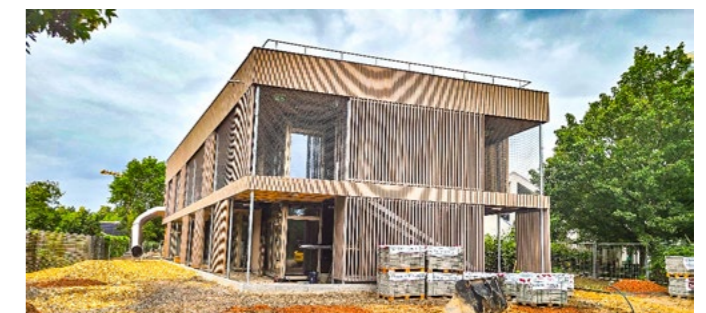
Ein modernes, energieeffizientes Gebäude und ein großzügiges Außengelände sollen am neuen Standort der Kita Monelli für eine anregende Lernumgebung sorgen.