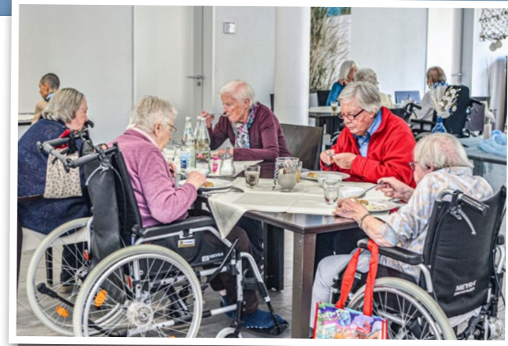
Bewohner*innen des Seniorenzentrums Grünwinkel genießen im Restaurant der Einrichtung ein herzhaftes, hausgemachtes Mittagessen.

Die gesetzlichen Pflegekassen stehen vor der Zahlungsunfähigkeit, da die gesamten Kosten der Pandemie, wie auch die durch die Inflation bedingten Preissteigerungen, zu Lasten der Versicherungsmittel gingen. Für 2022 beträgt das Defizit der gesetzlichen Pflegekassen 2,25 Mrd. Euro, 2023 werden 3 Mrd. Euro prognostiziert. Der Finanzierungsbedarf zur kurzfristigen Stabilisierung beträgt mindestens 4,5 Mrd. Euro