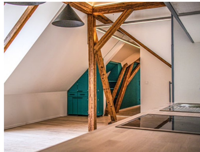
Das Herz der Wohngruppe bildet die frisch renovierte Küche.

Im Zuge der Umbauarbeiten erfuhr auch der Außenbereich des Gebäudes eine besondere Aufwertung. Inspirierende Ideen verwandelten den Hof und belebten den Spielplatz neu. Dabei hatte der Erhalt des historischen Baumbestandes einen hohen Stellenwert.