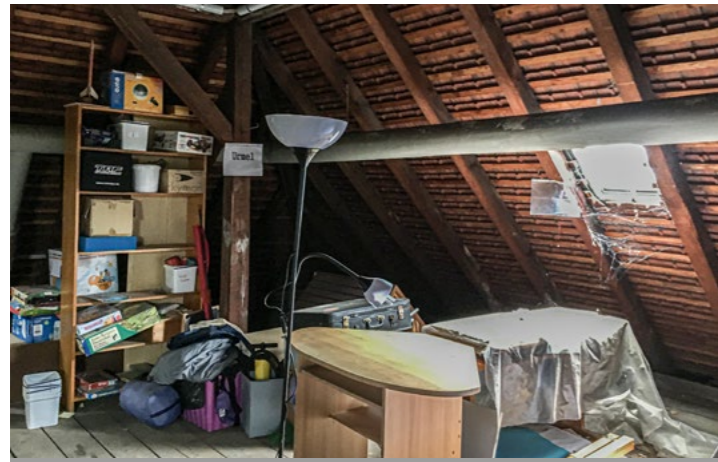
Vorher – das ungenutzte Dachgeschoss: 2021 begann der Umbau.