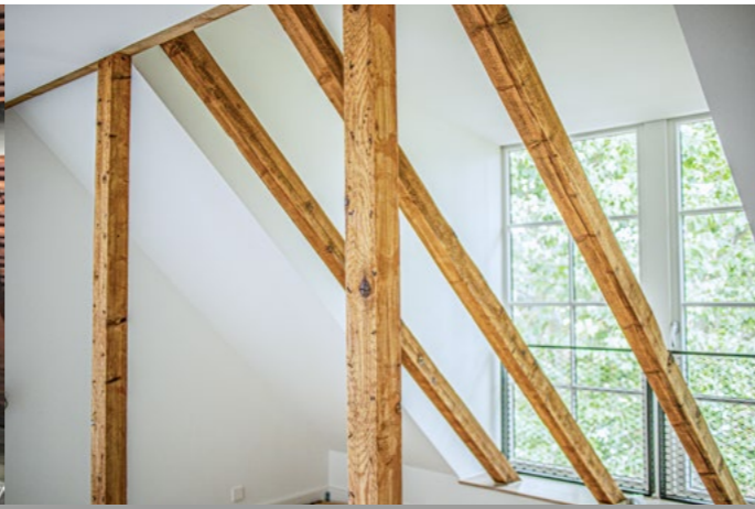
Nachher – von Alt zu Modern: Der beeindruckende Wandel des Dachgeschosses.

Wer hätte gedacht, dass der einstige Speicher, der von Tauben bevölkert wurde, und als Abstellkammer diente, herbergte, zu einem Ort der Hilfe und Geborgenheit für Kinder und deren Familien werden könnte? Doch genau das ist geschehen im Kinderhaus Aue, Westmarkstraße 71, Karlsruhe, im Sanierungsgebiet „Durlach-Aue.“