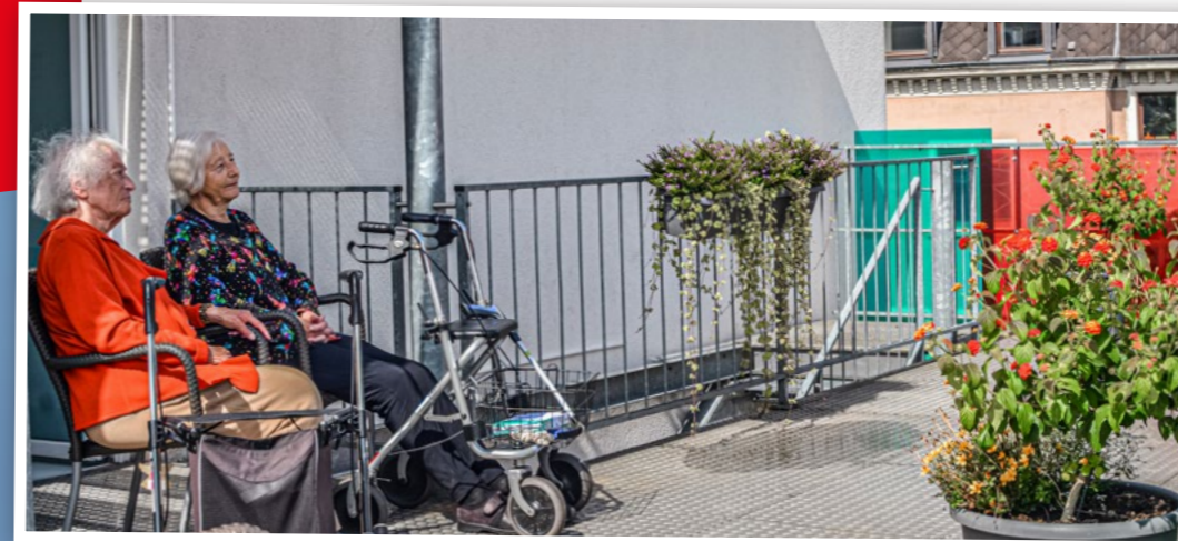
Gemütliche Stunden: Auf der begrünten Dachterrasse tanken die Bewohnerinnen des Seniorenzentrums Grünwinkel Sonne.

Bereits zum 1. Juli 2023 wurde der Beitrag zur Pflegeversicherung um 0,35 Prozent auf 3,4 Prozent angehoben; Kinderlose werden mit 4 Prozent noch stärker zur Kasse gebeten. Das soll Mehreinnahmen von rund 6,6 Mrd. Euro pro Jahr bringen. Mit diesen Mitteln sollen die Leistungen der Pflege dynamisiert und die Pflegekosten in der stationären Langzeitpflege gebremst werden. Zudem soll das Pflegegeld zum 1. Januar um 5 Prozent erhöht werden, ebenso die ambulanten Sachleistungen (Quelle: Bundesministerium für Gesundheit (BMG) 2023): Reform der Pflegeversicherung: mehr Leistungen für die stationäre und ambulante Pflege (Pressemitteilung).