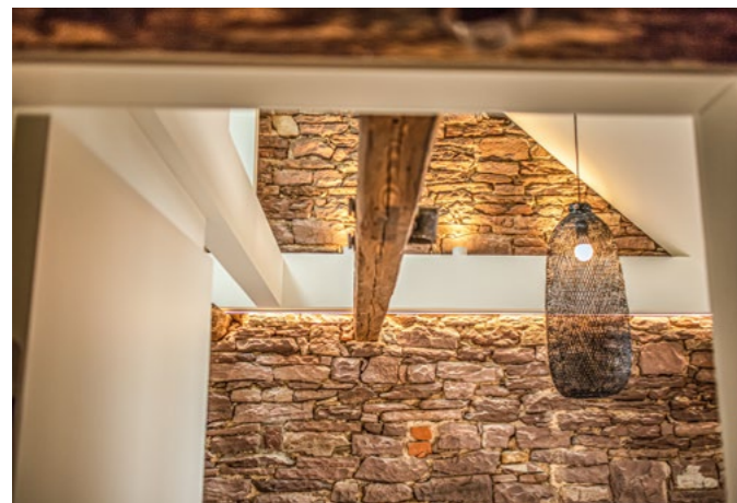
Ein Blick ins Mitarbeitendenbüro: die sanierte, historische Buntsandsteinwand erstrahlt in voller Pracht.

Das Projekt zeigt, wie sich historischer Charme mit modernen Anforderungen verbinden lässt und steht für unser Bestreben, sowohl die Vergangenheit zu respektieren als auch zukunftsorientierte Lösungen zu entwickeln.