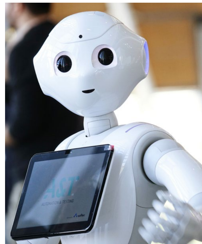
Der von Aldebaran Softbank Robotics SAS und SoftBank Mobile Corp. entwickelte humanoide Serviceroboter Pepper war der erste Roboter in der Kölner Klinik. Er wurde zur Ablenkung und Unterhaltung von Demenzkranken während der Corona-Pandemie eingesetzt.